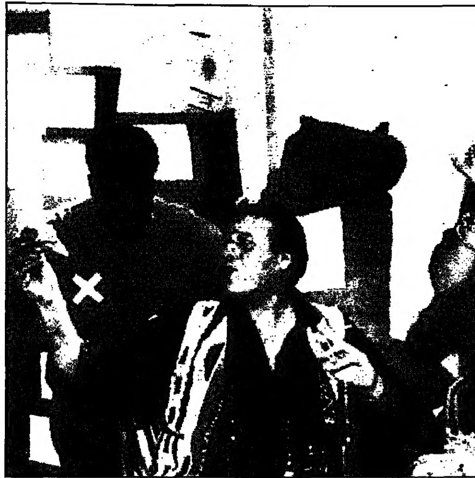
لقطة من فيلم «ابو العبد»